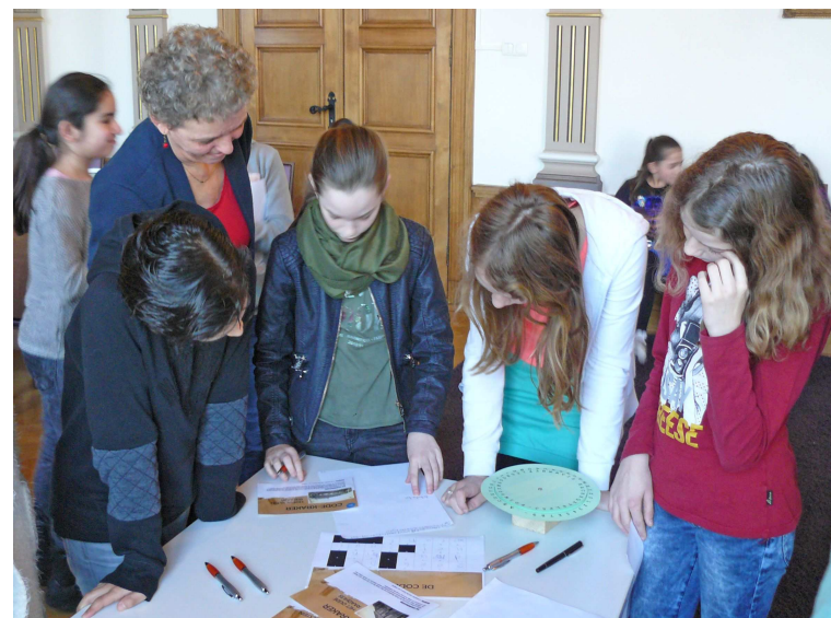
Een groepje leerlingen probeert één van de zeven raadselen op te lossen.