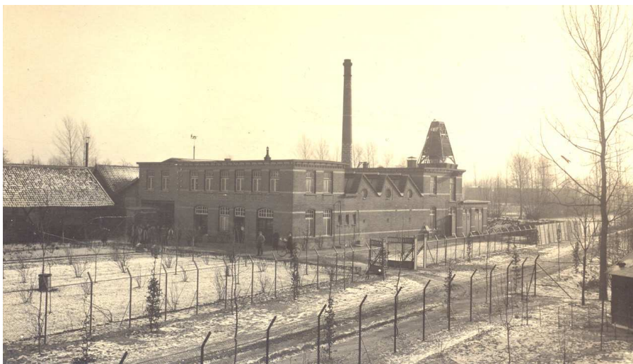
De op 1-9-1911 geopende "Stoomwasscherij De Lelie" aan de huidige Lelielaan

De plaatselijke middenstand zag daardoor haar omzet toenemen, maar ook in Veghel had de in 1911 gebouwde "Stoomwasscherij De Lelie" van Rath een goede klant aan het Udense Vluchtoord.