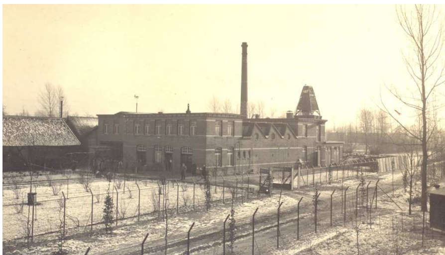
De op 1-9-1911 geopende "Stoomwasscherij De Lelie" aan de huidige Lelielaan