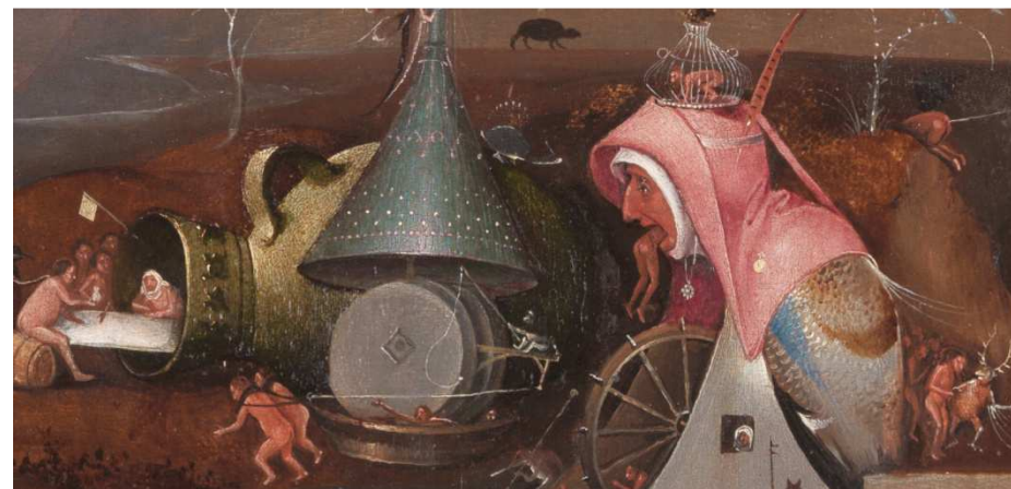
Detail uit "Het Laatste Oordeel" van Jheronimus Bosch

Vijfhonderd jaar na zijn overlijden is het jaar 2016 uitgeroepen tot het jaar van Jheronimus Bosch en van 13 februari tot en met 8 mei is er de grootse overzichttentoonstelling "Jheronimus Bosch - Visioenen van een genie" in het Noord-Brabants Museum in Den Bosch.