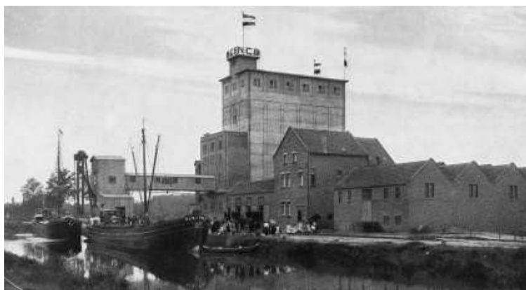
Het splinternieuwe gebouw van de C.H.V. van de N.C.B. in 1918

voor de NCB de ideale omstandigheden gecreëerd om in 1915 te besluiten daar de mengvoederfabrieken van De Coöperatieve Handels Vereniging te gaan bouwen.