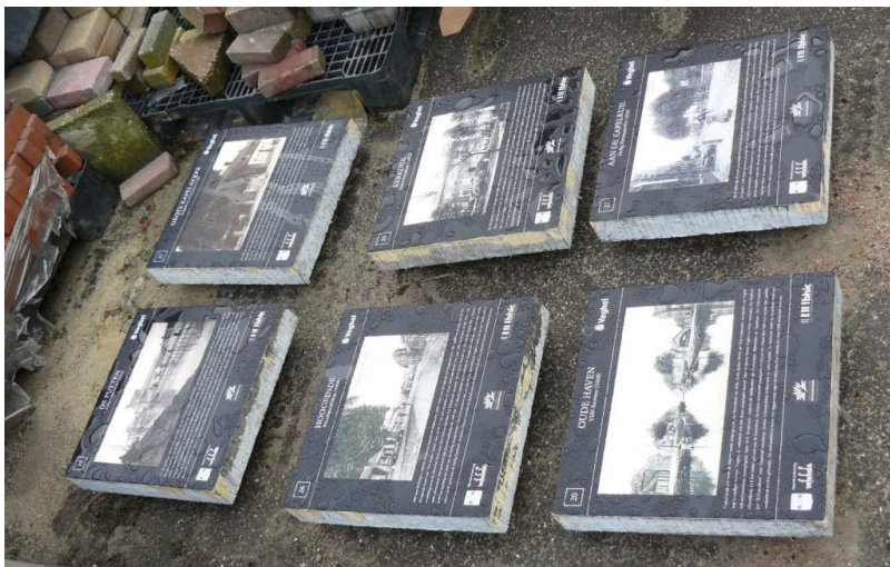
Deze liggen nog te wachten op de gemeentewerf

We hebben in Veghel nog veel meer interessante plekken waar we een attentietegel neer zouden willen leggen. We hebben er al 15 in voorbereiding maar om het uit te voeren moeten we eerst de nodige financiën bij elkaar zien te krijgen. Als U suggesties heeft zijn die van harte welkom.