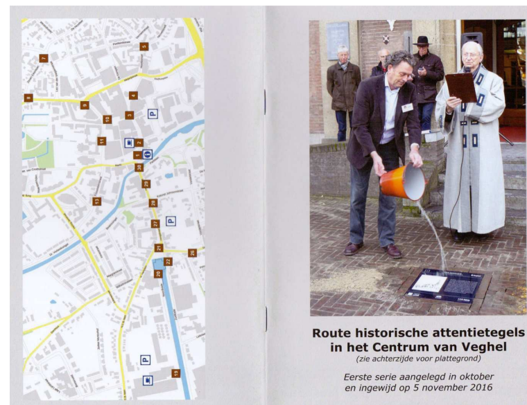
Omslag van het Routeboekje

Heemkundekring Vehchele heeft een routeboekje uitgegeven met alle informatie en afbeeldingen van de attentietegels die nu in het centrum van Veghel liggen.