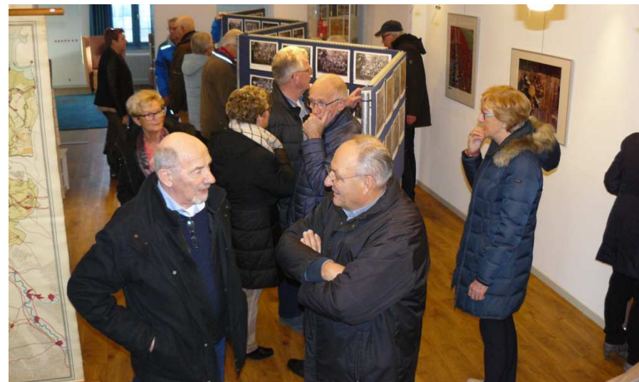
Lekker druk en samen herinneringen ophalen

Ook in de weken daarna werden dagelijks bezoekers gespot bij de foto's en werd er druk gebruik gemaakt van de gelegenheid om namen aan te vullen en foto's te bestellen.