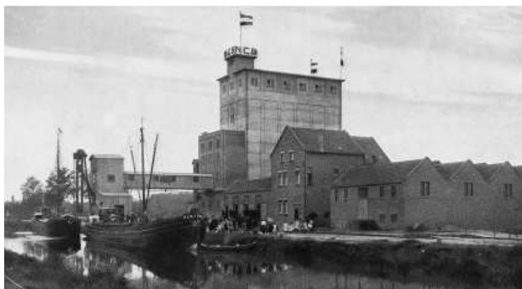
Het splinternieuwe gebouw van de C.H.V. van de N.C.B. in 1918

voor de NCB de ideale omstandigheden gecreëerd om in 1915 te besluiten daar de mengvoederfabrieken van De Coöperatieve Handels Vereniging te gaan bouwen.