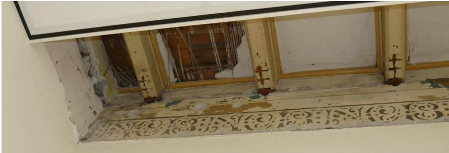
Her en der blijven herinneringen bewaard aan het verleden van het gebouw

man Campina. Zij hebben zoveel restwarmte dat alle gebouwen van de Noordkade er mee verwarmd kunnen worden. Daardoor is het prettig rondlopen door de Cultuur Haven Veghel.