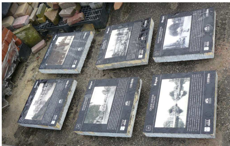
Deze liggen nog te wachten op de gemeentewerf

We hebben in Veghel nog veel meer interessante plekken waar we een attentietegel neer zouden willen leggen. We hebben er al 15 in voorbereiding maar om het uit te voeren moeten we eerst de nodige financiën bij elkaar zien te krijgen. Als U suggesties heeft zijn die van harte welkom.