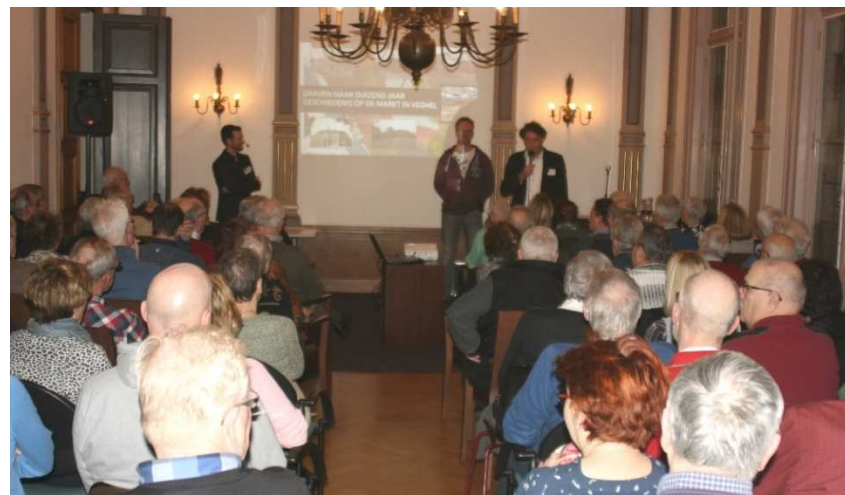
Een aandachtige volle zaal

Naast archeologische vondsten, toonde Kasper ook geologische verschijnselen in het bodemprofiel. In puntige stukken zand en leem van verschillende kleuren waren de gevolgen van de ijstijden terug te zien. De permafrost, de eeuwig bevroren ondergrond, had grillige patronen nagelaten. Hoger waren de sporen te vinden die het water van de Aa daar achter hadden gelaten die ongecontroleerd over de Veghelse "Markt" stroomde. In die lagen werden ook paalsporen aangetroffen van middeleeuwse huizen.