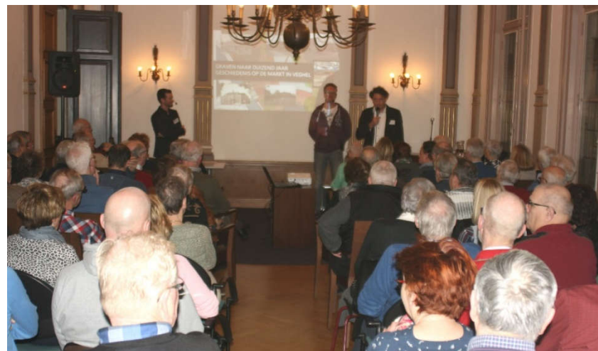
Een aandachtige volle zaal

Naast archeologische vondsten, toonde Kasper ook geologische verschijnselen in het bodemprofiel. In puntige stukken zand en leem van verschillende kleuren waren de gevolgen van de ijstijden terug te zien. De permafrost, de eeuwig bevroren ondergrond, had grillige patronen nagelaten. Hoger waren de sporen te vinden die het water van de Aa daar achter hadden gelaten die ongecontroleerd over de Veghelse "Markt" stroomde. In die lagen werden ook paalsporen aangetroffen van middeleeuwse huizen.