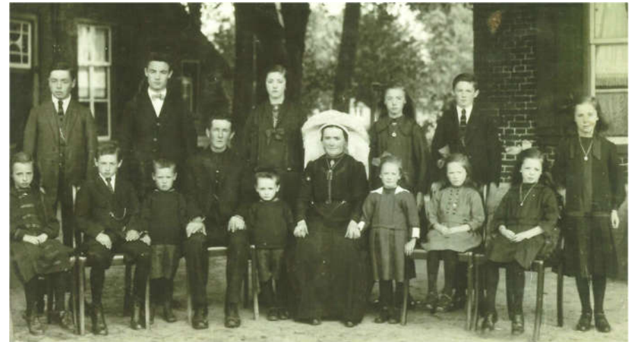
Het grote gezin waar Mgr. Bekkers in opgroeide.