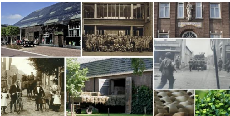
Fotocollage van Schijndel

Aanmelden is verplicht en kan tot 17 maart 2023 via de website www.vehchele.nl