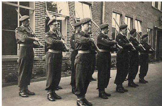
Peloton Uden 1953

Alle pelotons hadden een zelfde soort wapen. Er werd veel geoefend. Bij de schietoefeningen was de opkomst groter dan normaal. Het was leuker en interessanter dan theorielessen. Op de schietbanen in Langenboom werd geschoten met Lee Enfield geweren uit de vorige eeuw. Daar waren een stuk of zes houten stellingen waar vanaf geschoten werd. Op 80 meter afstand waren schietkelders die door ons zelf om de beurt bediend werden. Als iemand geschoten had op een bord van een vierkante meter moest de kelderman met een grote pijl het raakpunt aanwijzen. De schutter kon dan zien hoe gericht hij geschoten had. Na vijf schoten schoof men het bord omlaag en werden de gaatjes met papiertjes dicht geplakt. Het bord werd weer omhoog geschoven voor de volgende schutter. Dat gaat tegenwoordig allemaal met computers en laserstralen. Met mijn geweer moest ik precies richten op de rechter bovenhoek om de roos te raken. Ik won nog de tweede prijs ook. De instructeur die dat niet geloofde schoot toch in de roos, maar had wel mijn goede raad opgevolgd. Soms was er een wedstrijd met prijsjes zoals een horlogebandje of een vulpen.