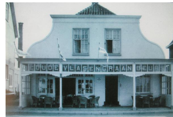
De oude Vlas- en Graanbeurs, het oudste café van Veghel. Rond 1924 werd de veranda gebouwd. In 1968 werd dit pand afgebroken voor de aanleg van de Vogelbeemdenlaan, nu: Vlas en Graan.

(naar een niet ondertekend stuk uit het redactiearchief, mogelijk van de heer Verbruggen)