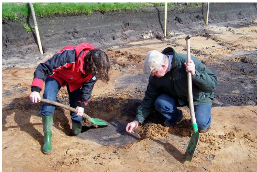
Ook de voorzitter is een goede schraper....

De opgraving werd op verzoek van de gemeente Veghel door de archeologische werkgroep uitgevoerd. De uitvoering door vrijwilligers was op dat tijdstip nog mogelijk, nog juist voor de aanneming van het verdrag van Malta; weliswaar met toestemming van De Rijksdienst voor Archeologie, Cultuurlandschap en Monumenten.