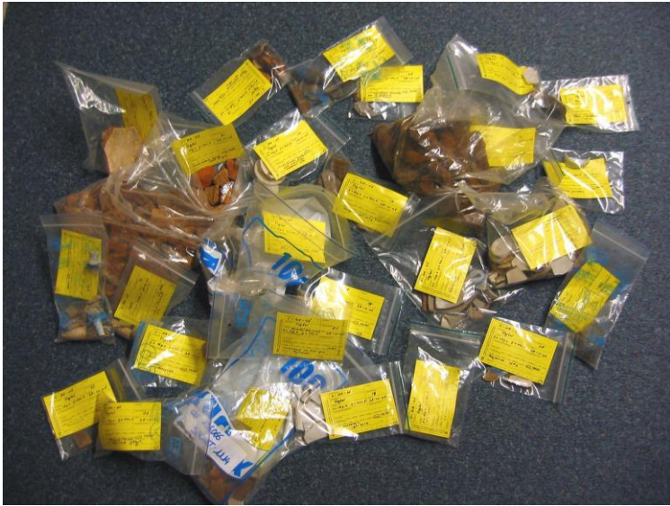
De schat in de akker die bij de veldloop op 28 oktober 2006 op de Eeuwsels door Veghelse en Erpse cursisten werd gevonden.