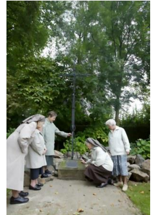
Het monument krijgt een mooie plaats in de tuin van de zusters

Omdat het Generaalat van de Zusters Franciscanessen SFIC verhuisd is naar de Deken van Miertstraat 8 en de kantoren naar de Frisselsteinstraat 5A en het huis met de tuin verkocht is, zoek je of er iets is, dat niet belangrijk is voor de nieuwe eigenaar, maar wel voor de Congregatie. Zo sta je dan voor het ijzeren kruis, dat eens stond op de kapel van het gasthuis/ziekenhuis in Veghel en dat later in de Hoogstraat 8, als monumentje een unieke plaats kreeg. Op 14 november 1989 werd het kruis daar geplaatst tussen de kapel (koetshuis) en het secretariaat van het Generaal Bestuur.