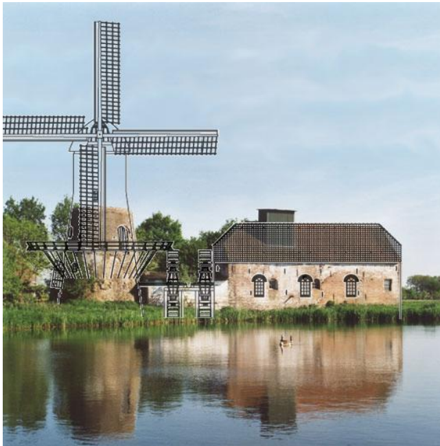
De molen hoe hij moet worden.