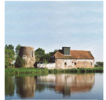
De molen in huidige staat.

De Kilsdonkse molen, gelegen in het prachtige beekdal van de Aa tussen Dinther en Veghel, is een unieke combinatie van een bijzondere watervlucht-korenmolen aan de ene oever van de rivier de Aa en een grote watergedreven oliemolen aan de andere kant. Twee schitterende molens met veel bijzondere en historische kenmerken, die volledig gerestaureerd en gereconstrueerd worden naar de situatie van 1880. Maar wat is er voor en na 1880 gebeurd? Hoe gaat het nu verder met deze molen?